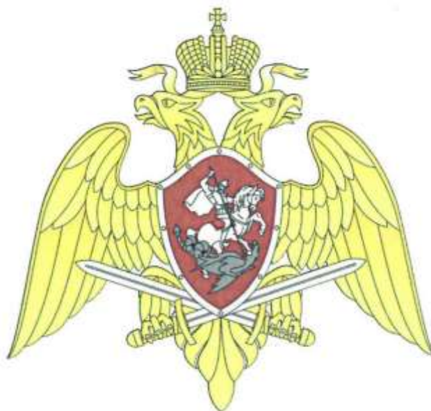
Рисунок геральдического знака - эмблемы войск национальной гвардии Российской Федерации. Многоцветный вариант.