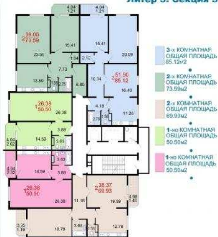
План типового этажа.

ЛИТЕР 1 И ЛИТЕР 3 ИМЕЮТ ОДИНАКОВЫЕ ПЛАНИРОВКИ