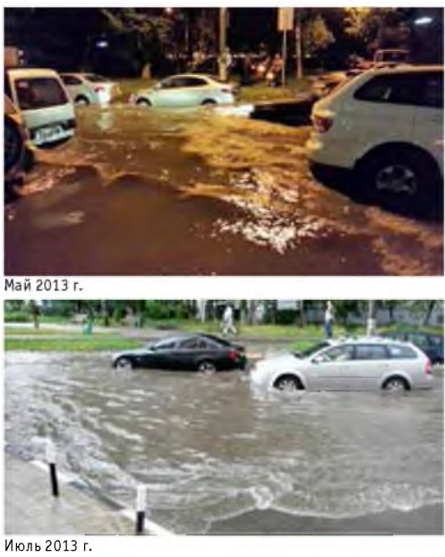
Июль 2013 г.