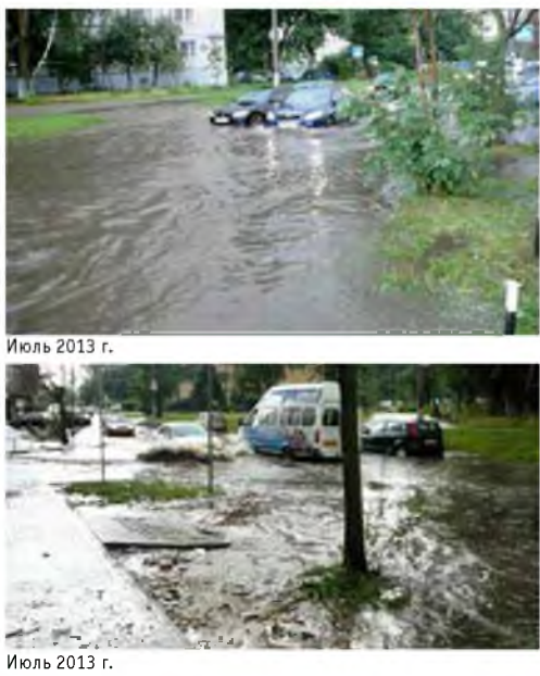
Июль 2013 г.